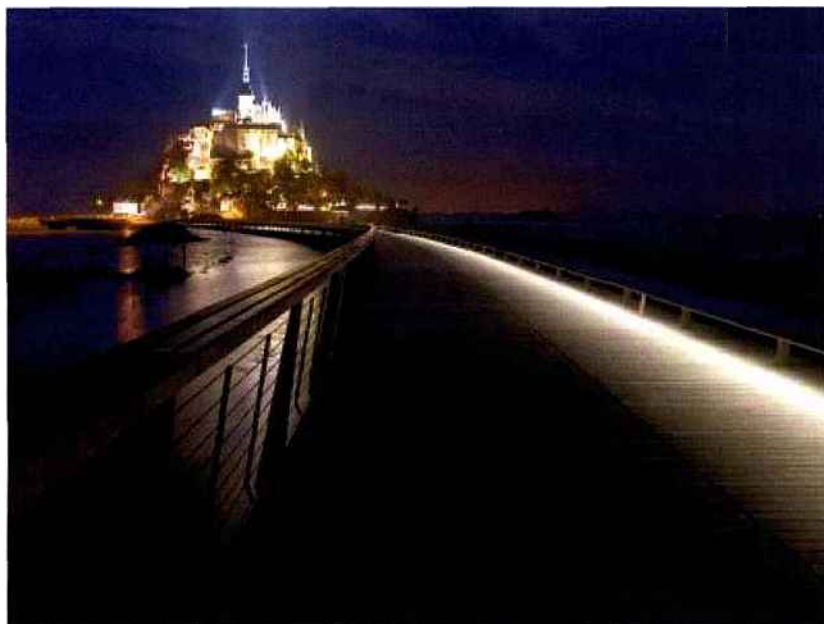
Marie Baillet / LEC ©