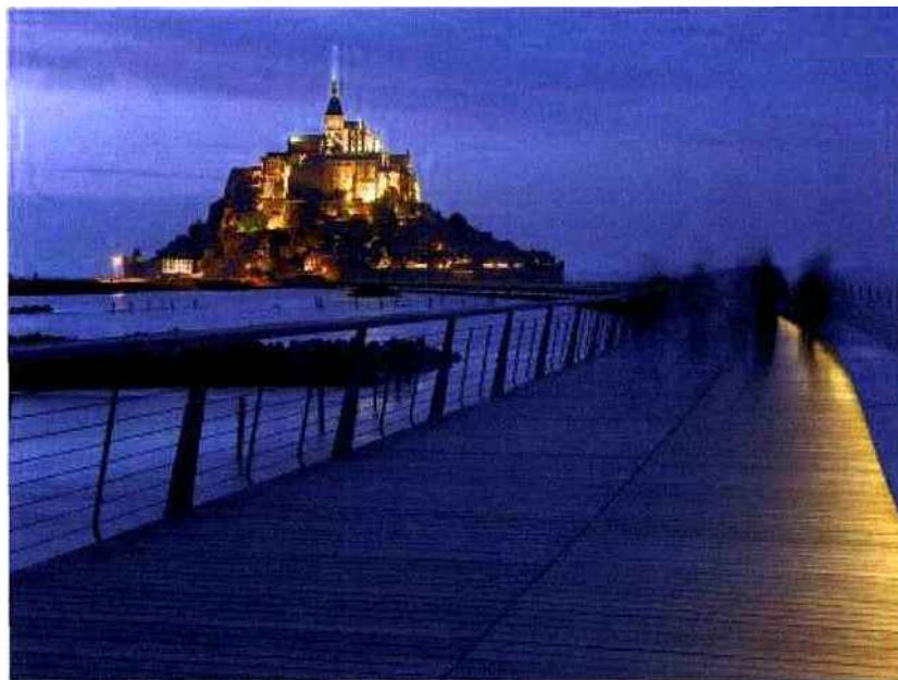
Mane Baillet / LEC ©