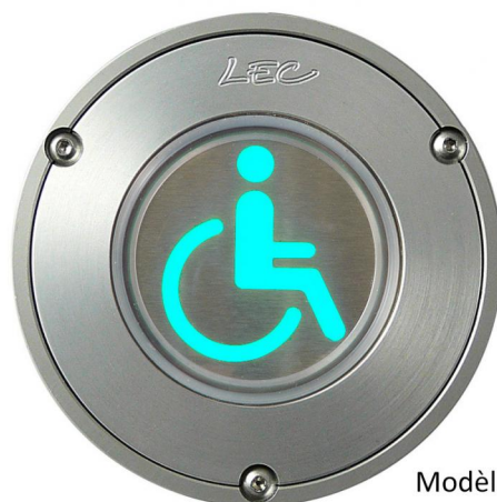
Modèle déposé (Europe)