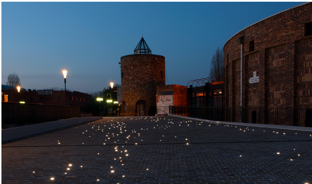
Les abords de l'Espace Culturel Boris Vian sont à la fois joliment mis en valeur et sécurisés.