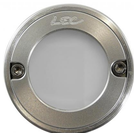
Fenêtre homogène Corps en aluminium usiné anodisé incolore