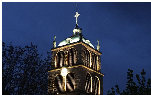
2 Lignon ref 5655 4000K de chaque côté de la toiture (8 au total) subliment le dôme du clocher et mettent en valeur sa couleur verte