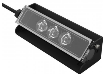
Version mini avec 3 LEDs