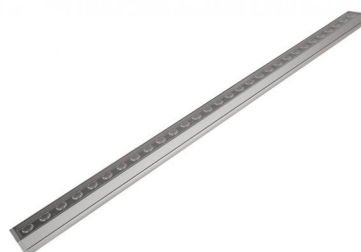
Longueur = 485 mm