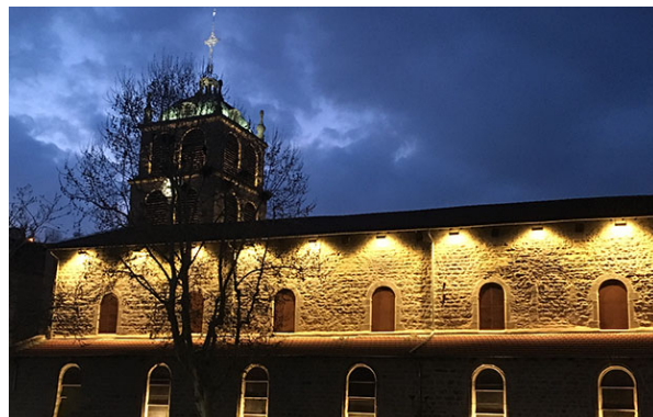
Plusieurs Lima ref 5683 3000K sont installés régulièrement tout au long de la façade côté jardin pour éclairer l'édifice et sublimer les murs en pierres.

Domaines d'applications LEC autour du patrimoine