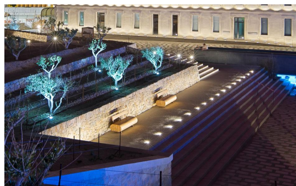
Projecteurs 5716-Allevard encastrés au sol autour des arbres

Domaines d'applications LEC autour du patrimoine