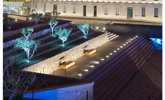
Projecteurs 5716-Allevard encastrés au sol autour des arbres

Domaines d'applications LEC autour du patrimoine