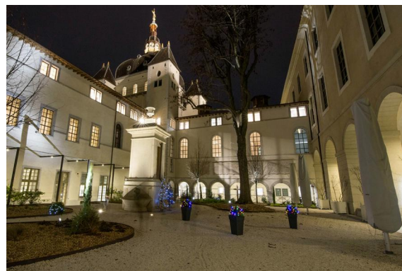
Mise en valeur de la fontaine centrale d'une des cours intérieures à l'aide de 4 projecteurs 2855-Meteor