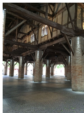
8 barreaux LEC 5633-Arches-BE6-L3 en blanc chaud sur le colombage du haut