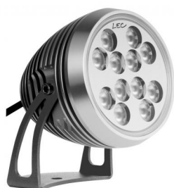
Orientable 2 axes