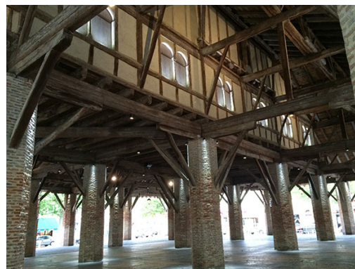
144 projecteurs LEC 4020-Luminy 2-CW-10-3W en blanc froid anodisés noir sur les piliers par le haut.