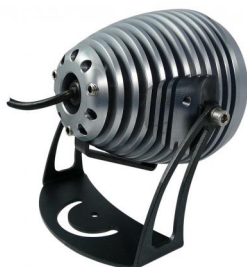
Orientable 3 axes