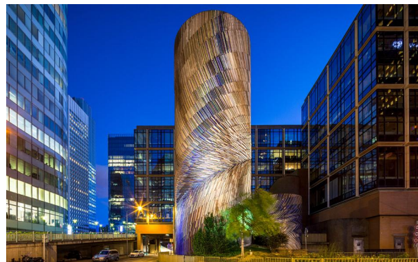
Vive le Vent - Michel Deverne (1985)

2 projecteurs 4040m-Luminy 4 en 12 LED 3W blanc neutre, optique L4 sont encastrés au sol.