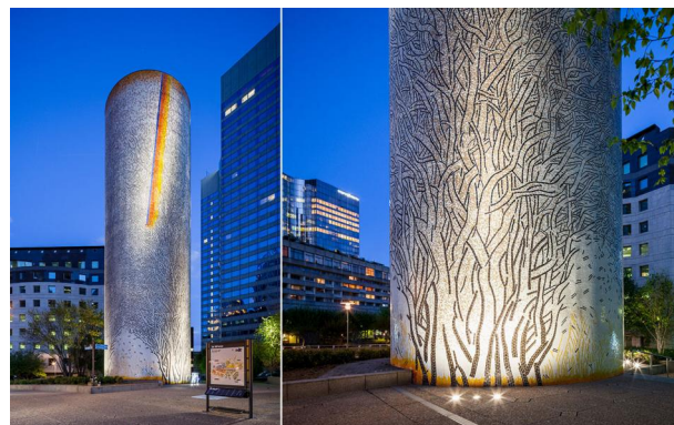
Les Trois Arbres - Guy-Rachel Grataloup (1988)

3 projecteurs en applique 4040-Luminy 4 en 12 LED 3W blanc neutre, optique 6° illuminent l'oeuvre.