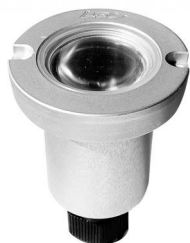
Corps en aluminium usiné anodisé incolore