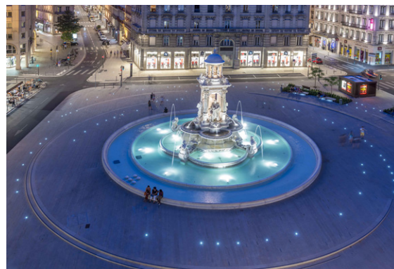
1750DSY-BW-BOURGOGNE Ø 44 mm 24 V DC 1 haute puissance