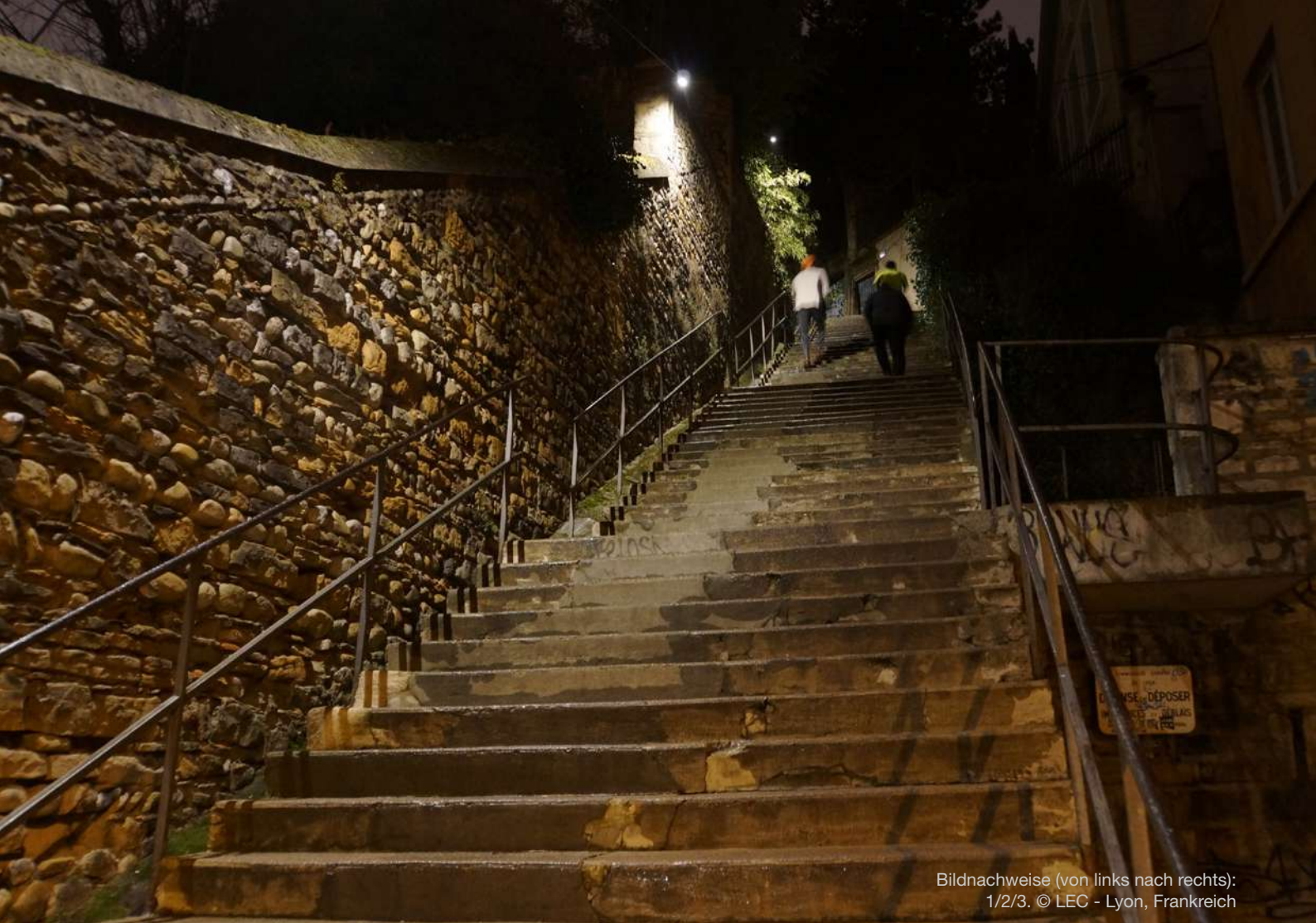
Bildnachweise (von links nach rechts): 1/2/3. © LEC - Lyon, Frankreich