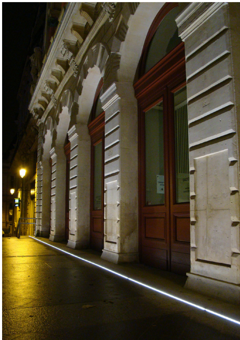
Créditos de las fotos (de izquierda a derecha): 1. © MFROMER - Lancy, Suiza | 2. © LEC - Bonneville, Francia 3. © LEC - Kirchberg, Luxemburgo | 4. © LEC - París, Francia