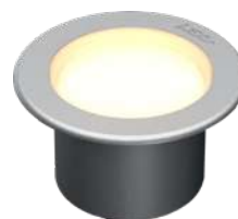
Cúpula arenada homogénea